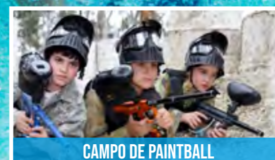
CAMPO DE PAINTBALL