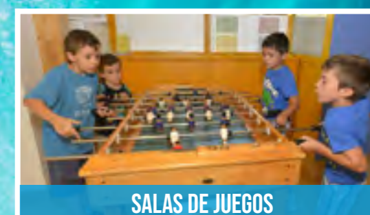
SALAS DE JUEGOS