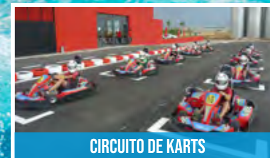
CIRCUITO DE KARTS