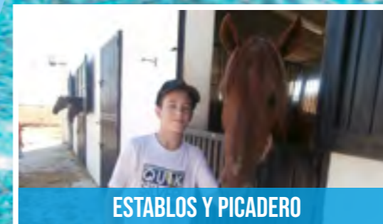
ESTABLOS Y PICADERO