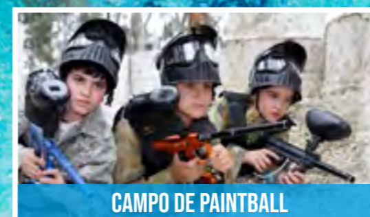
CAMPO DE PAINTBALL