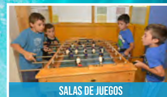
SALAS DE JUEGOS